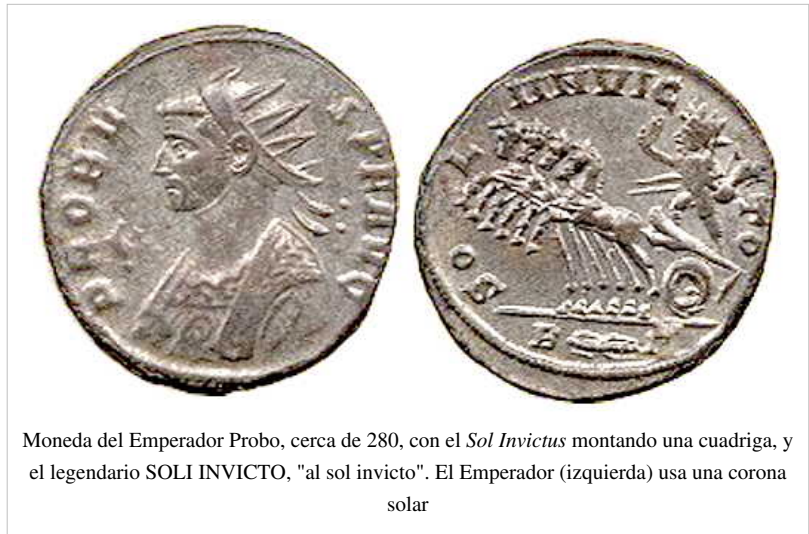
Moneda del Emperador Probo, cerca de 280, con el Sol Invictus montando una cuadriga, y el legendario SOLI INVICTO, "al sol invicto". El Emperador (izquierda) usa una corona solar

El emperador Constantino I (306-337) era un seguidor fiel de las tradiciones paganas (al dios Sol). Su conversión al cristianismo se debe a una visión que tuvo cuando vio una cruz frente al sol e iba con su ejército y escuchó una voz que le dijo " con este signo vencerás " (latín: in hoc signo vinces , 'con este signo vencerás' ) ? . Esto fue motivo para llevar el símbolo de una cruz en su estandarte y ganar la batalla del Puente Milvio.